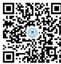
扫码下载“川旅门户”APP